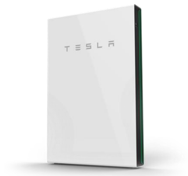
Backup Gateway W380 x D127 x H584mm

Backup Gateway はPowerwallと通信し、テスラアプリをインストールしたモバイルデバイスから電力消費量の確認やバックアップ用残量設定などの設定・管理を行うことができます。