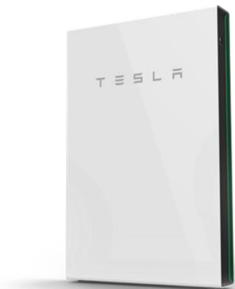
Powerwall W753 x D147 x H1150mm